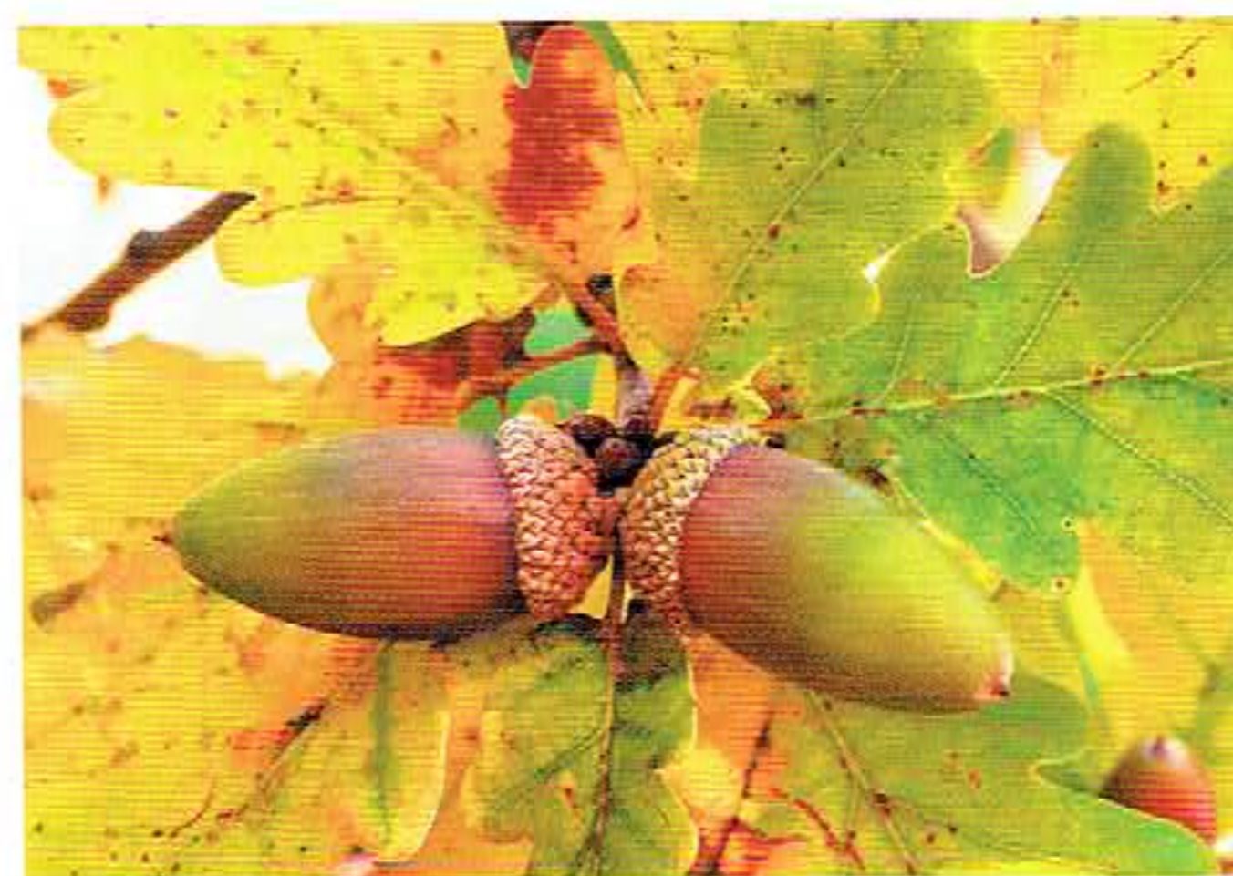
Owoce dębu to żołędzie.