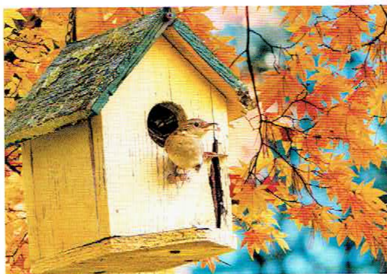
Domek chroni ptaki przed chłodem i drapieżnikami.