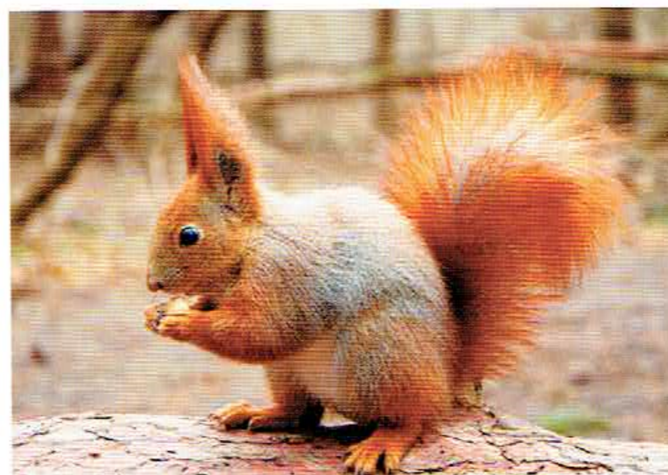
Wiewiórka jest objęta w Polsce ochroną częściową.