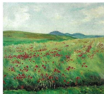
Henryk Weyssenhoff [czytaj: wajzenhof], Pole maków , około 1900 rok