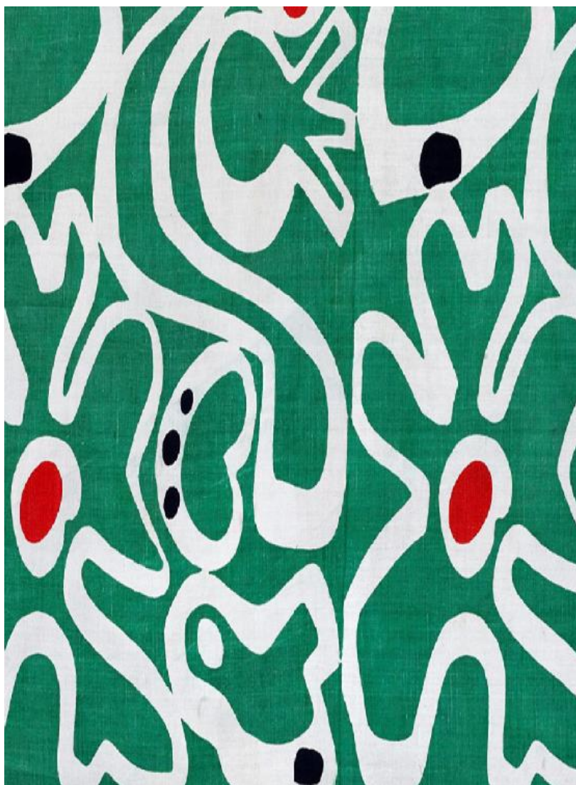
KRYSTYNA POLICZKOWSKA, Tkanina dekoracyjna ,druk, tkanina lniana, ok. 1965