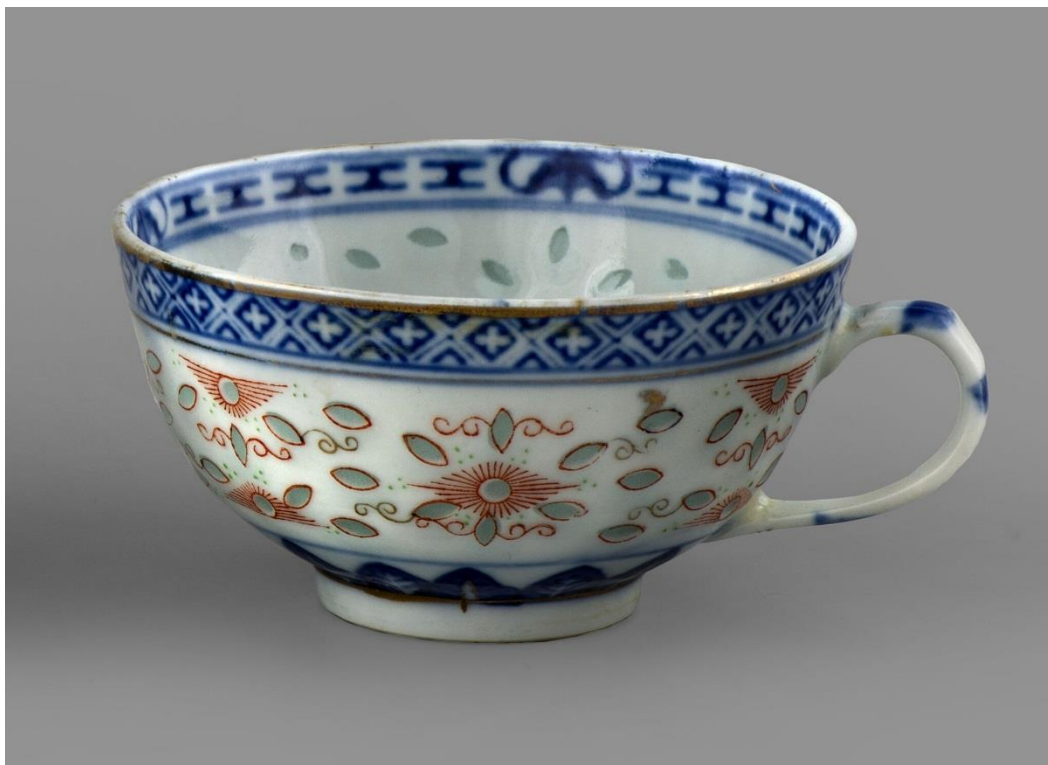
Autor nieznany, Filiżanka, XIX w. Chiny, Muzeum Narodowe w Warszawie