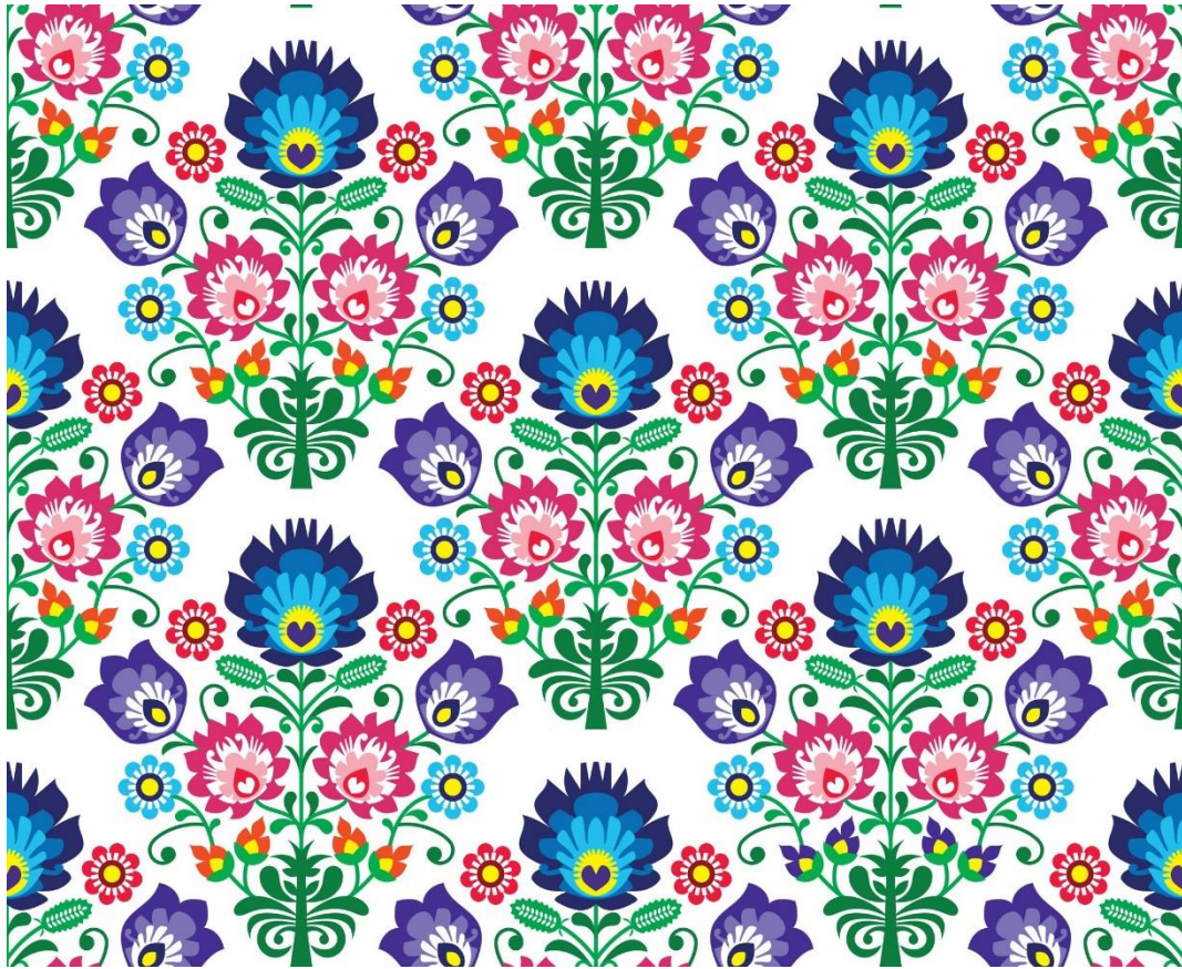
Ilustracja wektorowa, Wzory łowickie