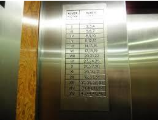
Numery pięter w windzie