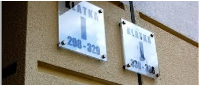
Numery klatek schodowych