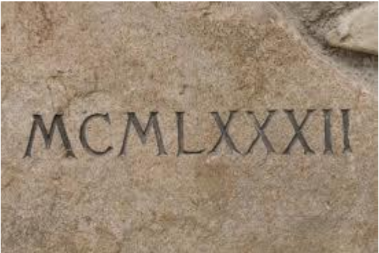
Oznaczenie danego roku