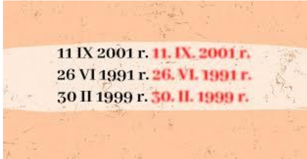
Oznaczenie miesięcy w dacie