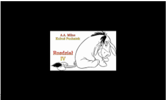
Oznaczenie kolejnych rozdziałów książki