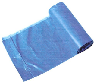
WOREK NA ŚMIECI